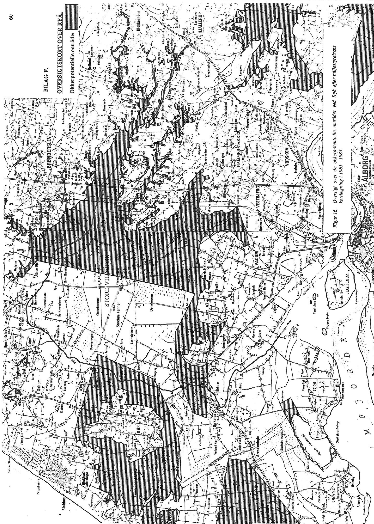
Figur 16. Oversigt over de okkerpotentielle områder ved Ryå efter miljøstyrelsens kortlægning i 1981 - 1983.